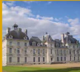
CHÂTEAU DE CHEVERNY