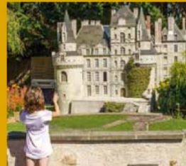
PARC DES MINIS CHATEAUX