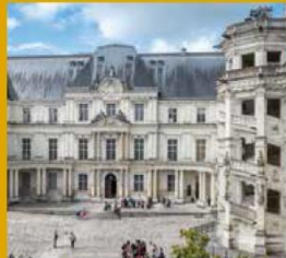
CHÂTEAU ROYAL DE BLOIS