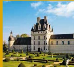
CHÂTEAU DE VALENÇAY