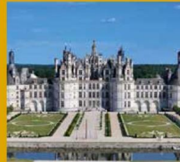
CHÂTEAU DE CHAMBORD