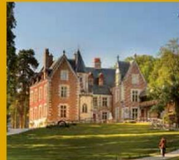
CHÂTEAU DU CLOS LUCÉ