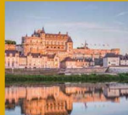
CHÂTEAU ROYAL D'AMBOISE