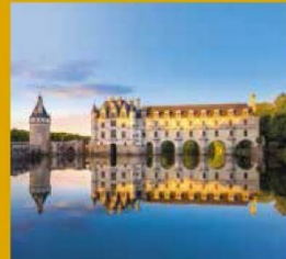
CHÂTEAU DE CHENONCEAU